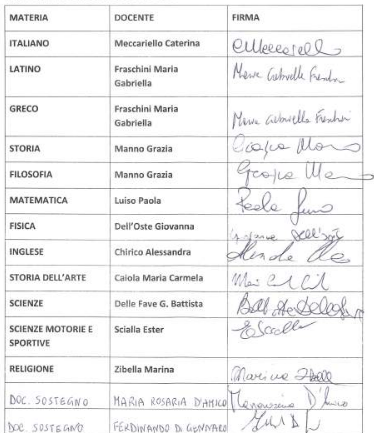
TABELLA FIRME DEL CONSIGLIO DI CLASSE